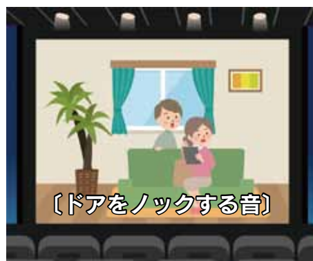
説明があるので状況がわかる