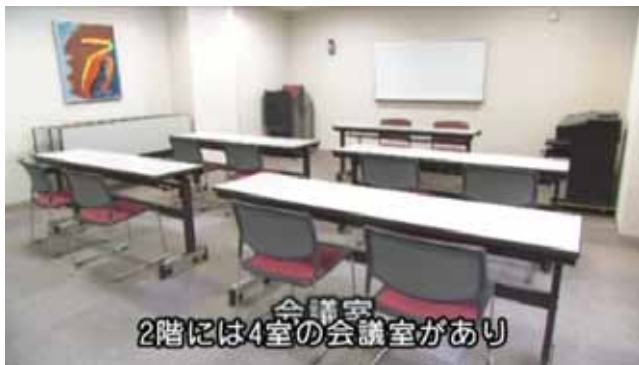
テロップと重なって字幕が読みにくいです

字幕を作るには聞こえてくるセリフを書き出し、字幕用に文章を整えて映像に合うように入力していきます。特に音起こしの作業は時間がかかり、何度も巻き戻して繰り返し聞きます。たいへん根気のいる作業です。なんとやっているのかわからなくて何度も聞いたり、表記の仕方を調べたりします。一般的なことばだけではなく、専門用語やその分野だけで使われることばもあり、時には制作元に聞いて確認しています。例えば「そば」を「蕎麦」や「ソバ」と表記することがありますが、元の映像に合わせて使い分けています。そのほうがより見やすく読みやすい字幕になるからです。