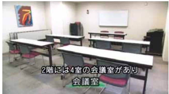
テロップと重ならないように字幕の位置を工夫しています

映像と字幕を合わせるときにも注意が必要です。最近はテロップが多くつかわれているため、テロップと重ならないように、時にはテロップを生かして字幕を入れることもあります。