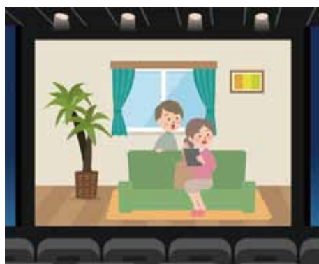
音の説明がないので状況がわからない

テレビ番組や長野県聴覚障がい者情報センターで制作・貸出しているDVDの字幕は、すべて聴覚障がい者用字幕です。